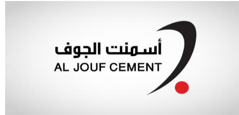
شركة أسمنت الجوف