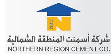
شركة أسمنت المنطقة الشمالية