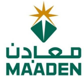
شركة معادن وعد الشمال